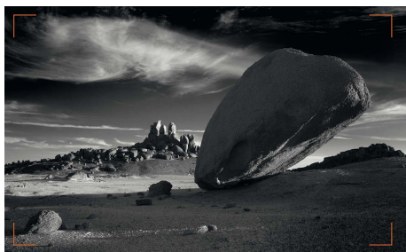
MICHAEL FREEMAN FOTOGRAFÍA EN BLANCO Y NEGRO EL ARTE INTEMPORAL DEL MONOCROMO