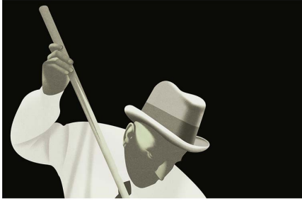
Martín Caparrós Todo por la patria